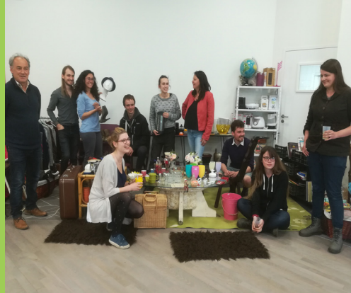
Un groupe de jeunes impliqués dans la Nerzh connexion