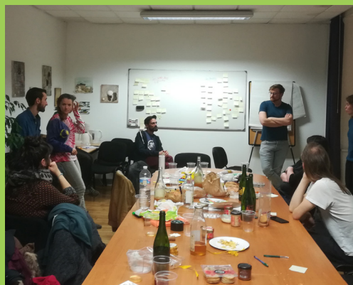
Atelier d'échange entre jeunes porteurs de projet