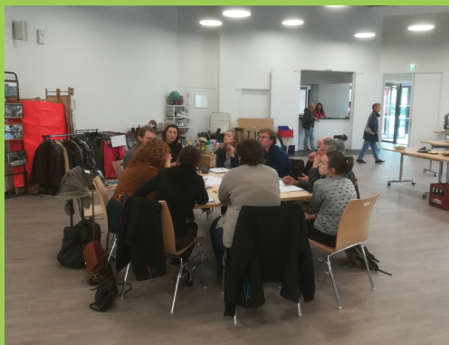
Ateliers d'échanges entre jeunes et acteurs du territoire