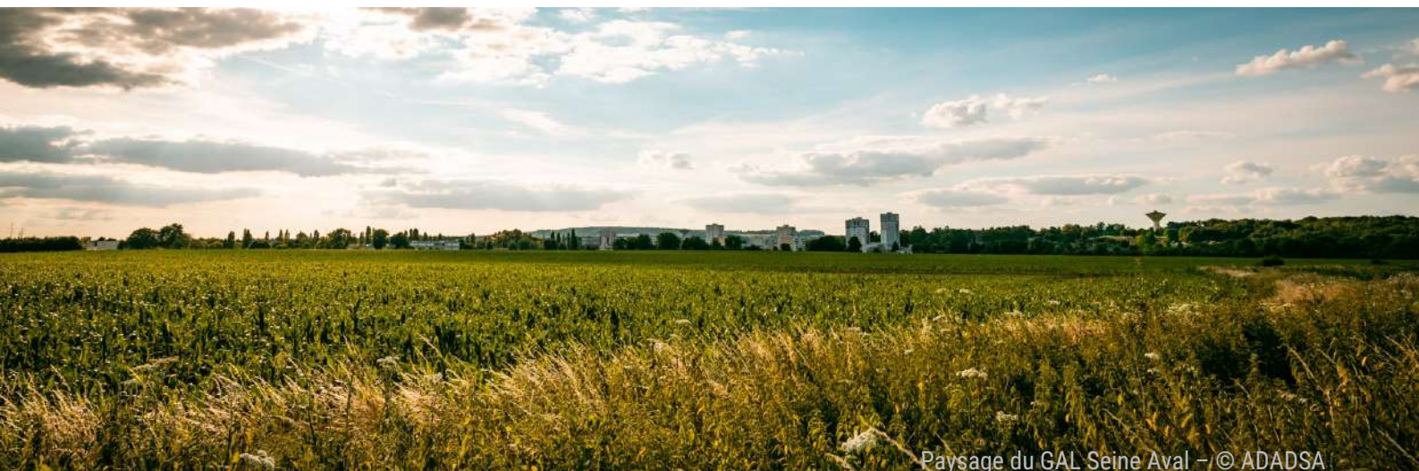
Paysage du GAL Seine Aval