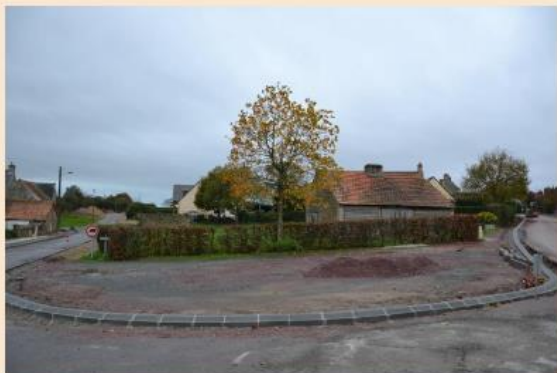
Emplacement identifié avant la construction

2015 : Incendie de l'ancienne boulangerie et départ de l'ancien boulanger