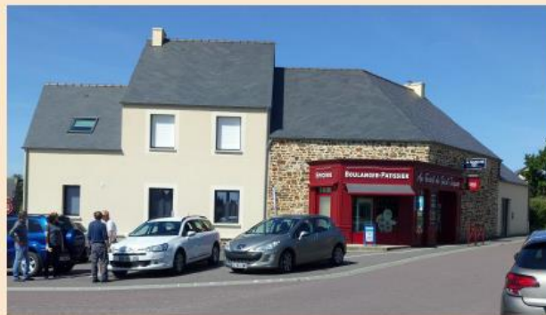
La boulangerie-épicerie et le logement attenant