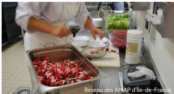
Réseau des AMAP d'Île-de-France