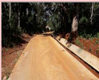
Piste de Ouangani Sud avant/après