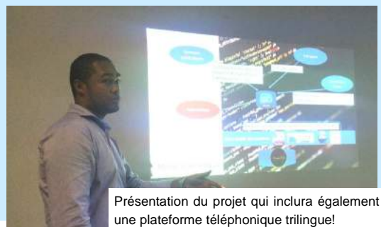
Présentation du projet qui inclura également une plateforme téléphonique trilingue!