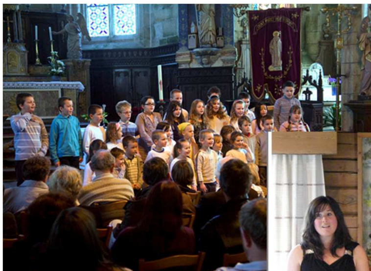
Concert des enfants du Juch au festival