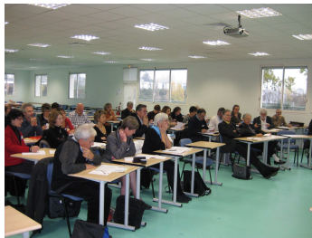
Séminaire sur la GTEC à Toulouse – déc. 2009

d'une entreprise (80 licenciements) qui réveille la démarche sur la communauté de communes de Lomagne Gersoise, via l'embauche d'un agent de développement chargé de recueillir les besoins d'entreprises du territoire afin d'accueillir les salariés licenciés. 60 emplois sont créés, soutenus à hauteur de 3 000 euros pour chacun d'entre eux. C'est, ensuite, la mise en œuvre d'un programme appelé Arcades, financé par le FSE, qui permet de concrétiser une démarche de GPEC à l'échelle du Pays. L'objectif est de former les communautés de communes à cette problématique afin d'instituer un accompagnement permanent des entreprises.